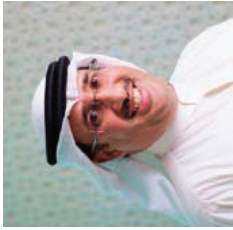
Mohammed bin Essa Al Khalifa